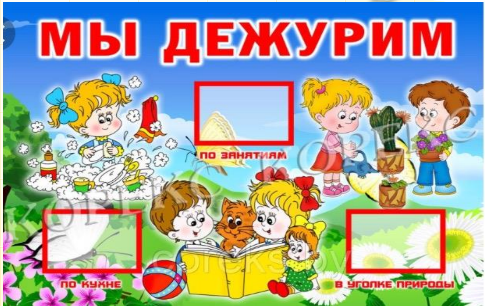
Схема работ позволяет детям делать выбор, основываясь на индивидуальных различиях, интересах детей и стимулирует развитие самостоятельности и взаимопомощи.